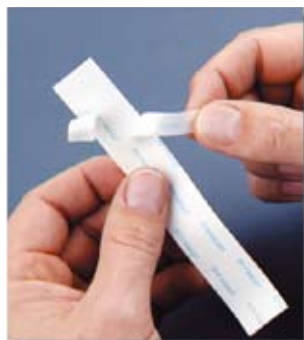
Łatwo ściągalna etykieta z dzieloną tylną warstwą

Etykiety, które po przyklejeniu wytrzymują bardzo długo